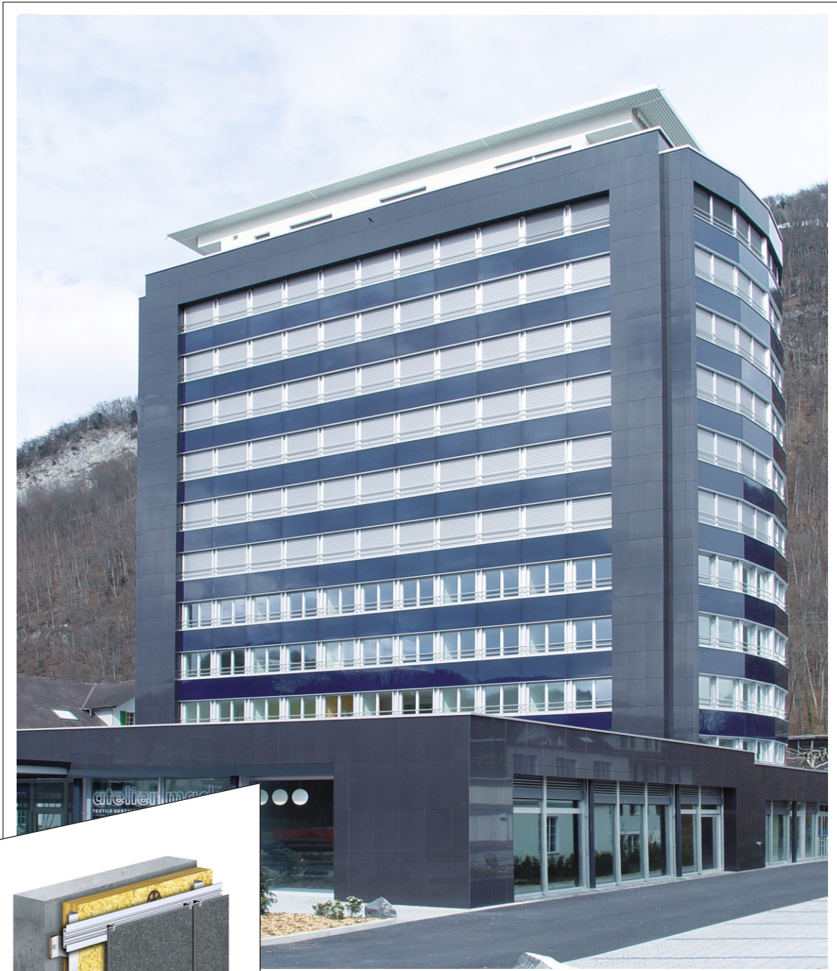
Wohn- und Geschäftshaus Mirage-Center, Stans