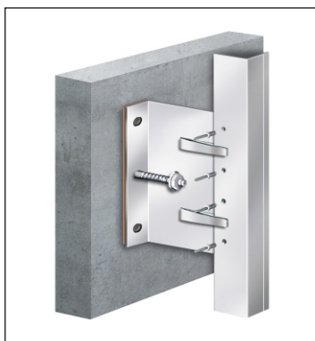
Ecolite - V