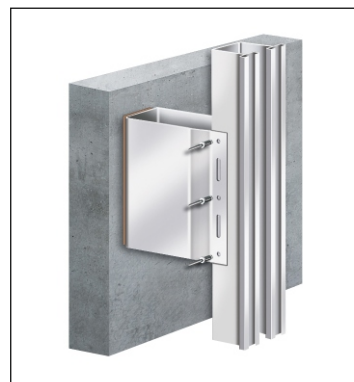
Ecolite - U