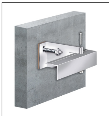
Ecolite - H

Nos spécialistes des processus système forment un réseau dense dans toutes les régions linguistiques de la Suisse.